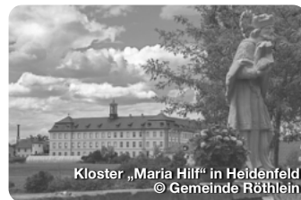
Kloster „Maria Hilff“ in Heidenfeld

Tradition und Moderne verbinden sich im Markt Werneck zu einem lebendigen Miteinander. Sehenswürdigkeiten, sind das Fränkische Bildstockzentrum in Egenhausen, der Obstpfad in Schleiereth oder das von Balthasar Neumann erbaute Schloss. TreffpunktDeutschland.de/werneck