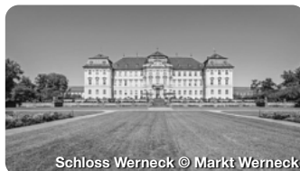
Schloss Werneck

Gezeigt wird die größte Ausstellung zum zivilen Luftschutz während des Zweiten Weltkriegs und des Kalten Kriegs. Untergebracht im Fichtel-und-Sachs-Bunker. Ernst-Sachs-Straße 73, Schweinfurt