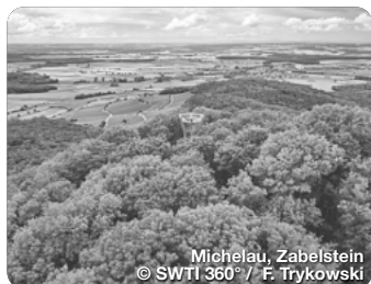
Michelau, Zabelstein

Die unterschiedlichen Landschaften bieten unzählige Entdeckungsmöglichkeiten, verbunden durch romantische Wanderwege und ein exzellentes Radwegenetz. Aktivurlauber und Naturliebhaberinnen finden in der Umgebung zahlreiche Erholungsoasen. Zwischen malerischen Waldkuppen liegen reizvolle Winzerorte und mittelalterliche Dörfer, während einige Buchten und Seen im Schweinfurter Land Wasservergnügen versprechen. Historische Museen und Ausstellungen zeugen von einem reichen Kulturschatz. Eine Entdeckertour um Sulzheim und sein Gips-Informationszentrum gewährt faszinierende Einblicke in die Welt des Gipses. In Schwanfeld, im ältesten Dorf in Deutschland, siedelten sich dank des milden Klimas die ersten Bauern an. Im Bandkeramik Museum können Sie über 400 Tonfiguren und Keramikunst aus der Steinzeit bestaunen. TreffpunktDeutschland.de/schweinfurt-region