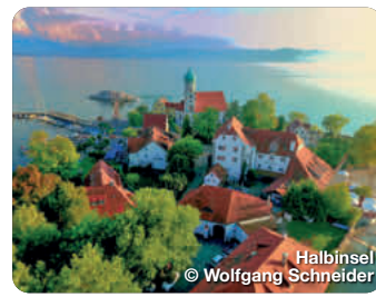
Halbinsel © Wolfgang Schneider