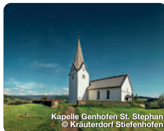
Kapelle Genhofen St. Stephan

Den Wald aus der Vogelperspektive genießen? Vom bis zu 40 Meter hohen, barrierefreien Baumwipfelpfad „Skywalk“ warten faszinierende Ausblicke auf die Allgäuer Bergwelt und den funkelnden Bodensee, sowie spannende Einblicke in den Kosmos Wald Oberschwenden 25, Scheidegg