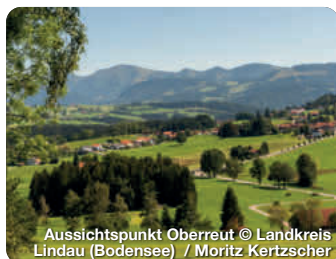
Aussichtspunkt Oberreit