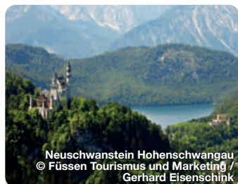
Neuschwanstein Hohenschwangau

Alle Termine und Angaben unter Vorbehalt!