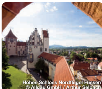
Hohes Schloss Nordflügel Füssen

Das Allgäu überrascht: geliebte Traditionen, frische Kulturalität, die authentische und bodenständige Küche. Gemeinsam ist allen die hohe Qualität der Angebote. Ob Gastgeber, Restaurant oder die Qualität der Wege. Überzeugen Sie sich selbst. Das Allgäu erschließt sich dem Besucher zunächst über seine malerische Landschaft, seine imposanten Gipfel, seine herrlichen Wanderwege oder bezaubernden Seen. Aber war da nicht noch etwas? Ja richtig: Schloss Neuschwanstein, der Märchenkönig und mit ihm der Blick auf die kulturelle und historische Vielfalt einer Region, die es verdient, aus dem Schatten der Berge zu treten. Pisten, Loipen, Hütten und der schöne Blick auf die weißen Alpen. Ein Winterurlaub wie im Märchen. TreffpunktDeutschland.de/allgaeu