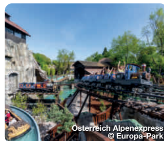
Osterreich Alpenexpress