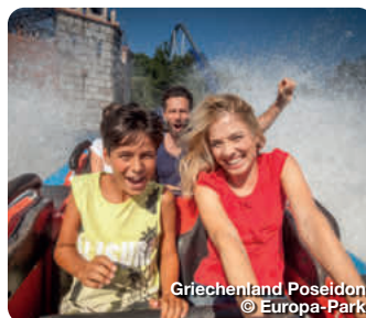
Griechenland Poseidon

Reiselust und Fernweh gehören zum Sommer wie Eiscreme und Sonnenbrille. Ganz gleich, ob man von einer kühlen Brise an nordischen Fjorden träumt oder sich am liebsten zwischen Palmen und türkisblauem Wasser entspannt – im Europa-Park Erlebnis-Resort ist immer die perfekte Zeit für Urlaub. Die 17 europäischen Themenbereiche laden in der Jubiläumssaison zu einer atemberaubenden Reise über den Kontinent ein. Mit über 100 Attraktionen und Shows, landestypischer Architektur und authentischer Küche ist Deutschlands größter Freizeitpark seit genau 50 Jahren das ideale Ausflugsziel für die ganze Familie. In direkter Nachbarschaft befindet sich mit Rulantica außerdem eine einzigartige Wasserwelt, die zu jeder Jahreszeit fantastischen Wasserspaß im Innen- und Außenbereich bietet. Die sechs parkeigenen 4-Sterne (Superior) Hotels und die Silver Lake City mit Tipi Town, Camping und Caravanning runden den Kurzurlaub im Europa-Park Erlebnis-Resort ideal ab. Rust