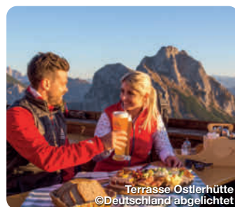
Terrasse Ostlerhütte

Inmitten prachtvoller Natur, eingebettet in eine atemberaubende Bergkulisse, zwischen Seen, Wiesen und Wäldern, liegt der herrliche Markt Nesselwang. Die Marktgemeinde liegt in luftiger Höhe von 870 Metern und ist ein anerkannter Luftkurort im Landkreis Ostallgäu. TreffpunktDeutschland.de/nesselwang