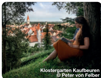
Klostergarten Kaufbeuren

Wie ein Schatzkästchen liegt er im Herzen des Allgäus, im bayerischen Süden Deutschlands. Er ist einer von neun Erlebnisräumen der Region und erstreckt sich über den gesamten Landkreis Ostallgäu, von Füssen über Pfronten, Nesselwang, Halblech, Marktoberdorf bis nach Kaufbeuren und Buchloe. Die königliche Gipfelkulisse aus Ammergau, Allgäuer und Tannheimer Bergen wachen wie steinerne Riesen über mystische Seen, rauschende Flüsse, sanft gewellte Hügelmeere und sattgrüne Wiesen, zwischen die Dörfer und historischen Städte eingebettet sind. Die archaische Poesie der Landschaft wirkt wie ein großer, weiter Park, der sich vor den vielen Schlössern und Burgen der Region ausbreitet, vor allem zu Füßen des Märchenschlosses Neuschwanstein. TreffpunktDeutschland.de/ostallgaeu