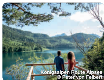
Königsalpen Route Alpsee