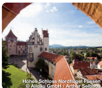
Hohes Schloss Nordflügel Füssen