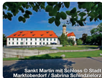
Sankt Martin mit Schloss

Halblech im Allgäu Der Allgäuer Urlaubsort liegt inmitten einer traumhaften Landschaft mit herrlichem Panoramablick auf die Berge und Seen, ideal für Wanderer und Radfahrer. Tipps: Fahrt mit der Sesselbahn auf den Buchenberg, beheiztes Freibad in Trauchgau. TreffpunktDeutschland.de/halblech