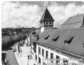
Historisches Rathaus