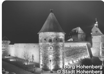
Burg Hohenberg