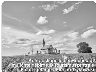
Konradskapelle bei Höchstädt im Fichtelgebirge

TreffpunktDeutschland.de/wunsiedel-region