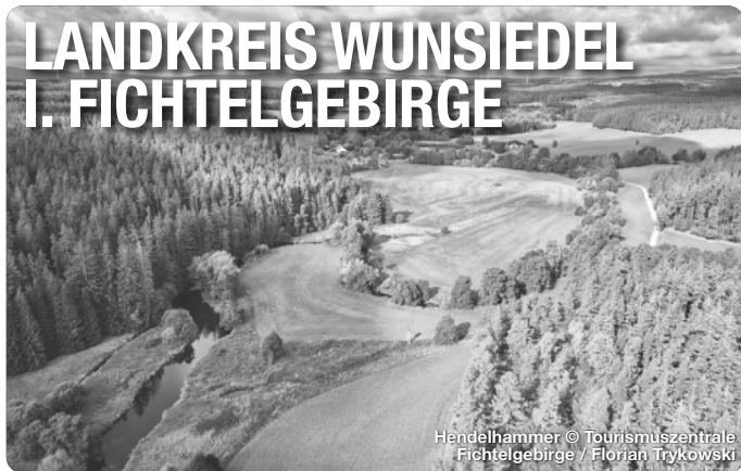
Hendelhammer © Tourismuszentrale Fichtelgebirge / Florian Trykowski

Alle Termine und Angaben unter Vorbehalt!