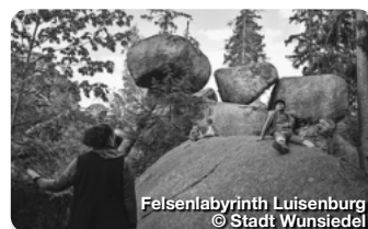
Felsenlabyrinth Luisenburg