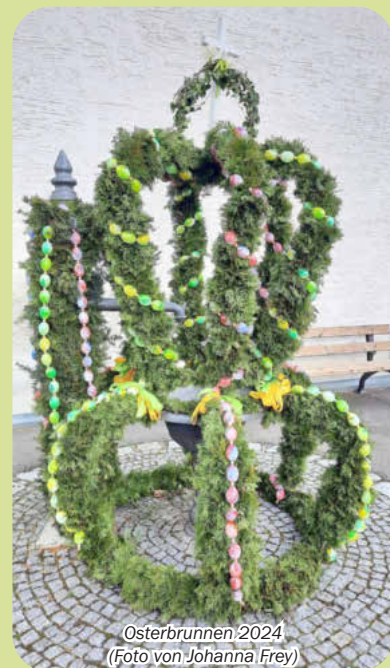
Osterbrunnen 2024