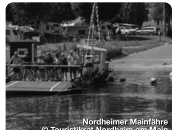
Nordheimer Mainfähre

Alois Alzheimer, geboren 1864 in Marktbreit, beschrieb 1906 eine spezielle Demenzform. Emil Kraepelin benannte diese später nach ihm als „Alzheimersche Krankheit“. Mainstraße 6, Marktbreit