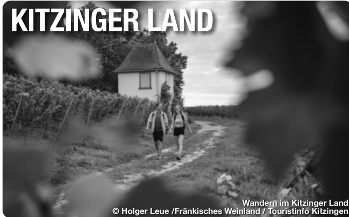
Wandern im Kitzinger Land

Das Kitzinger Land ist ein „Tausendsassa“! Hier findet jeder das Richtige – der Erholungssuchende schlendert durch mittelalterliche Dörfer, entschlendert in einem unserer wunderschönen Parks und genießt herrliche Weine, der Aktive schnürt die Wanderstiefel, schwingt sich aufs Rad oder taucht in die Geschichte ein. Vieles lässt sich zu Fuß entdecken – beispielsweise bei einer Wanderung auf einer unserer 15 TraumRunden. Hier finden Wanderer beste Bedingungen für einen unvergesslichen Ausflug: wenig Asphalt, naturnahe Pfade, weite Blicke und viele Besonderheiten auf oder neben der Wegstrecke machen die Wanderungen zu einem Erlebnis der besonderen Art. Auch mit dem Fahrrad lohnt sich eine Tour. TreffpunktDeutschland.de/kitzinger-land