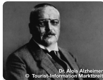
Dr. Alois Alzheimer

Erstmals 889 urkundlich erwähnt, ist Mainbernheim ein Städtchen umrahmt von einem Stadtmauerring mit 18 Türmen und 2 Toren und vorgelagerten Grabengärten. TreffpunktDeutschland.de/mainbernheim