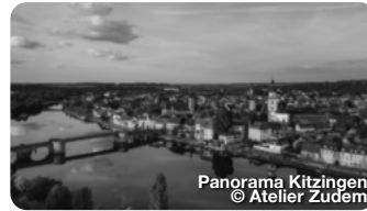
Panorama Kitzingen

Exponate aus fünf Jahrtausenden und vier Erdteilen gibt es im bedeutenden Knauf-Museum zu bestaunen. Die Meisterwerke sind im historischen, ehemaligen Amtshaus in meisterlichen Abformungen ausgestellt. Am Marktplatz, Iphofen