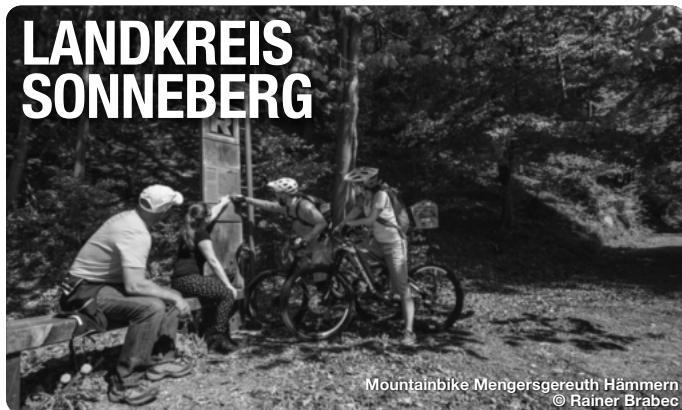
Mountainbike Mengersgereuth Hämmern

Alle Termine und Angaben unter Vorbehalt!