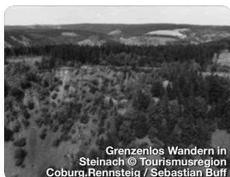
Grenzenlos Wandern in Steinach

LANDKREIS SONNEBERG Der Landkreis Sonneberg, gelegen im Herzen des malerischen Thüringer Waldes, ist eine wahre Schatzkammer für Naturfreunde, Handwerkbegeisterte und Erholungssuchende gleichermaßen. Die Spielzeugstadt Sonneberg, weltbekannt für ihre lange Tradition in der Spielzeugherstellung, begeistert Besucher mit ihrem Deutschen Spielzeugmuseum, dem Deutschen Teddybärenmuseum und einer Vielzahl von Attraktionen rund um das Thema Spielzeug. Das historische und bis heute ansässige Glashandwerk ist eher im Norden des Landkreises in und um Lauscha zu finden. Dort wurde übrigens auch die Gläserne Christbaumkugel erfunden! Bis heute werden viele wunderschöne Unikate aus Glas in vielen kleinen Manufakturen und Hütten gefertigt. TreffpunktDeutschland.de/sonneberg-region