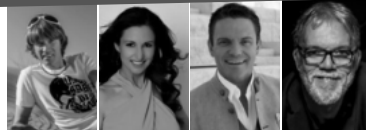
Mickie Krause, Anita Hofmann, Stefan Mross und Wolfgang Trepper