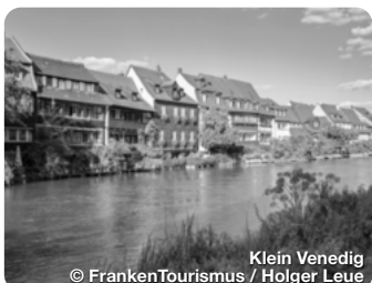
Klein Venedig