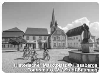
Historischer Marktplatz