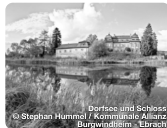
Dorfsee und Schloss

Alles über Blue Jeans. Levi Strauss, der Vater der Blue Jeans. Levi Strauss kam aus dem kleinen fränkischen Ort Buttenheim. Geboren wurde Löb Strauss, wie Levi Strauss ursprünglich hieß, am 26. Februar 1929. Marktstr. 33, Buttenheim